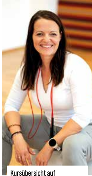
Kursübersicht auf konditionsschule.t-base.at

Die t-base Konditionsschule startet im Frühling wieder mit dem kostenlosen Jackpot Fit Trainingsprogramm ins Frühlings-Sommer-Semester – für Neueinsteiger*innen kostenlos!