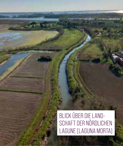
BLICK ÜBER DIE LANDSCHAFT DER NÖRDLICHEN LAGUNE (LAGUNA MORTA)