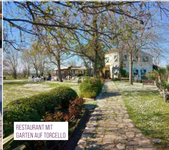
RESTAURANT MIT GARTEN AUF TORCELLO