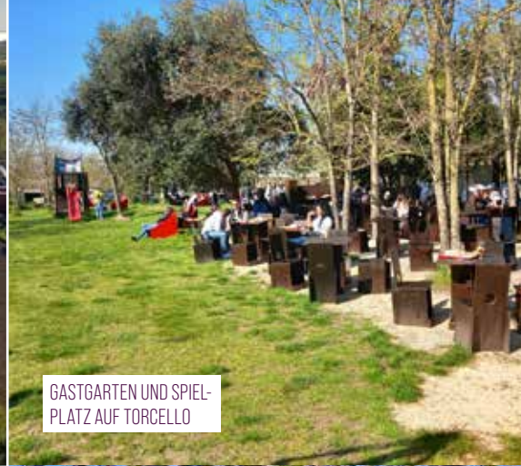
GASTGARTEN UND SPIELPLATZ AUF TORCELLO