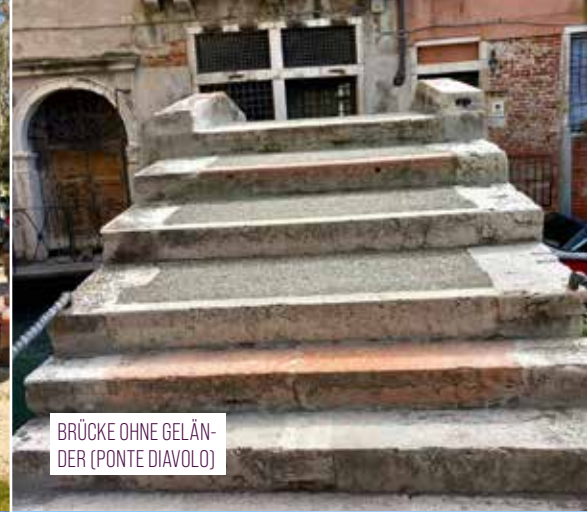
BRÜCKE OHNE GELÄNDER (PONTE DIAVOLO)