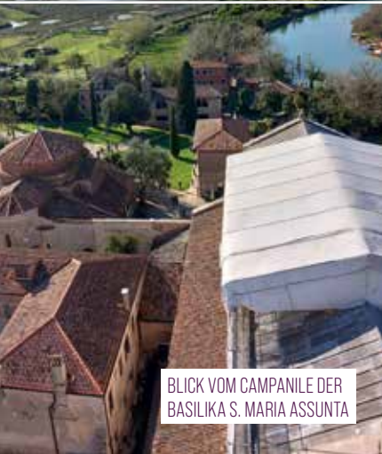
BLICK VOM CAMPANILE DER BASILIKA S. MARIA ASSUNTA