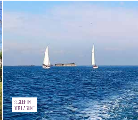
SEGLER IN DER LAGUNE

sen Publikationen nachlesen. Schon damit wäre wohl eine Woche in Venedig inhaltlich ausgefüllt und gut verwendet.